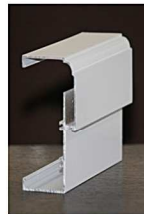
Profil kusen aluminium

Pintu anti rayap, stabil, tahan air/cuaca