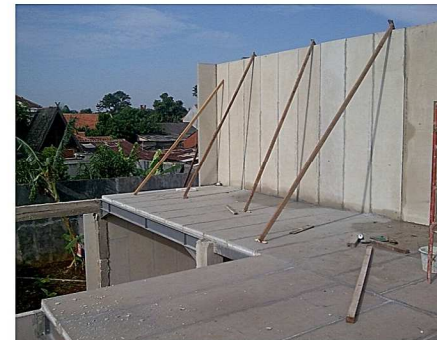
Lantai dan dinding quipanel