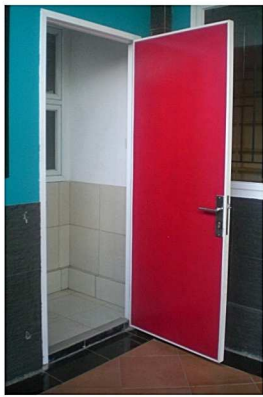
Pintu kamar mandi

Kusen aluminium extrusion dengan finishing powdercoating, tebal 1,4 mm dengan ukuran disesuaikan dengan ketebalan dinding quipanel