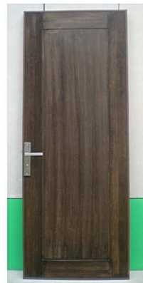
Pintu motif kayu