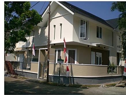
Rumah tinggal Jakarta

Pintu anti rayap, stabil, tahan air/cuaca