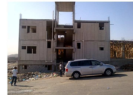
Kantor di Makkah Saudi Arabia