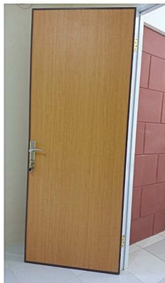
Pintu motif kayu