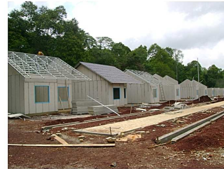
Rumah type 36 m 2 Pulau Sebuk