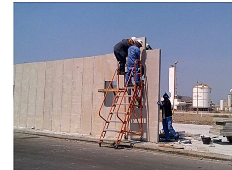
Gedung kantor Rmco, Saudi Arabia